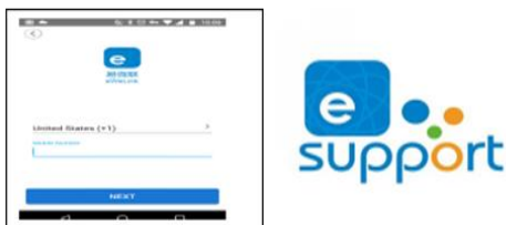
Gambar 4 Pengunduhan Aplikasi

Dalam menggunakan alat kewanan rumah berbasis android ini proses pemasangan alat ini harus dilakukan oleh ahli di bidang prorotype . Lalu setelah alat ini terpasang di rumah selanjutnya pengguna dapat langsung mengunduh aplikasi dan mensinkronisasikannya dengan alat yang telah terpasang. Berikut langkah-langkah pengunduhn dan pengoperasian aplikasi alat kewanan rumah: