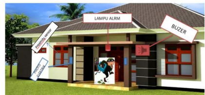
Gambar 3 Ilustrasi kerja alat

Adapun gambaran pengembangan produk Alat keamanan rumah berbasis android sebagai berikut: