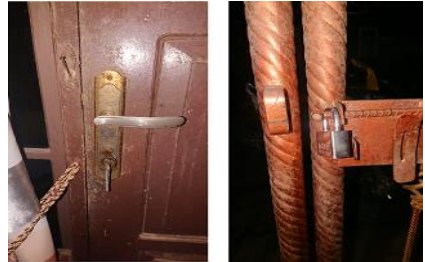
Gambar 1 Sistem keamanan di salah satu rumah di Kavling Nato Permata.

Dari penelitian ini, data yang diambil di Kavling Nato Permata yaitu masyarakat di Kavling Nato Permata masih menggunakan kunci manual dan gembok.