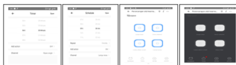
Gambar 5 Fitur Alat Keamanan Rumah Berbasis Android

Langkah pertama silahkan download Ewelink di Appstore ataupun Playstore lalu registrasi melalui email atau nomor handphone, lalu masukan IP module sonoff.