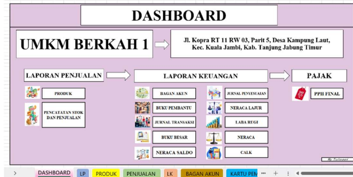
Gambar 2 Sheet Dasboard UMKM Otomatis

Dashboard UMKM Retail Berkah 1 dirancang sebagai halaman utama yang memudahkan pemilik mengakses semua sheet pencatatan dan laporan keuangan secara tersusun. Data dari produk hingga pajak penghasilan final terhubung otomatis dan diperbarui secara real-time .