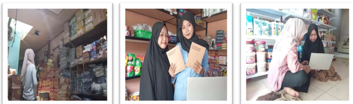
Gambar 16 Observasi, Wawancara, dan pendampingan pelaku UMKM

Penerapan digitalisasi pencatatan keuangan berbasis Microsoft Excel pada UMKM Retail Berkah 1 mengubah pencatatan dari sederhana menjadi lebih sistematis dan tersusun sesuai SAK EMKM, sehingga pelaku usaha dapat menyusun laporan laba rugi dan posisi keuangan secara terukur. Hal ini meningkatkan pemahaman tentang kondisi keuangan dan kinerja usaha, membedakan antara omzet, laba, dan kas, serta menata perhitungan beban usaha secara tertib. Selain itu, laporan keuangan yang rapi menjadi dasar pengenalan kewajiban perpajakan secara bertahap, membantu pelaku UMKM memahami pajak sebagai bagian dari kegiatan usaha dan membangun kesadaran serta kepatuhan perpajakan sejak awal.