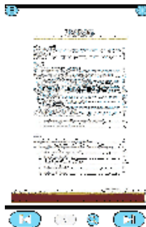
Gambar 5. Daftar Isi

Aplikasi ini dilengkapi dengan daftar isi yang digunakan untuk mempermudah pengguna dalam mencari sub materi yang ingin dipelajari. Klik tombol next untuk melihat daftar isi halaman berikutnya.