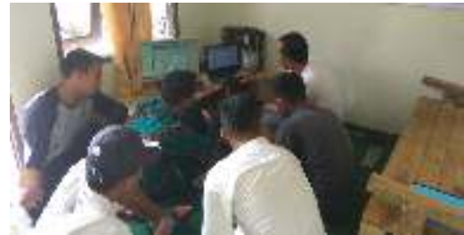
Gambar 3. Suasana Pelaksanaan Kegiatan

Kegiatan pertama dilakukan pada tanggal 23 Desember 2018 dengan memberi gambaran tentang aplikasi yang akan digunakan. Kemudian dilanjut pada pertemuan kedua dan ketiga pada tanggal 30 Desember 2018 dan 6 Januari 2019.