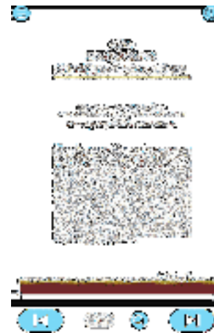
Gambar 7. Materi Bab 2

kolonialisme dan imperialisme pada aplikasi virtual learning Sejarah Indonesia.