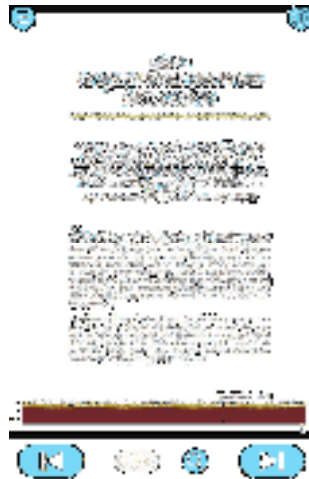
Gambar 9. Materi Bab 4