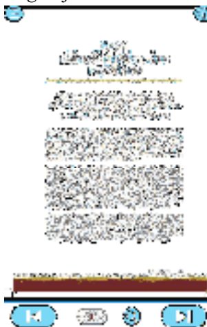
Gambar 6. Materi Bab 1

Berikut adalah tampilan materi untuk bab 1 tentang antara kolonialisme dan impererialisme pada aplikasi virtual learning Sejarah Indonesia.