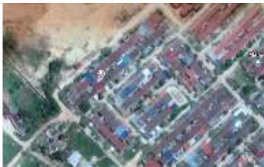
Gambar 2 Lokasi Pelaksanaan

Kegiatan pengabdian kepada masyarakat dilaksanakan sesuai dengan kalender Pengabdian Kepada Masyarakat yang diselenggarakan oleh LPPM. Kegiatan ini dilakukan sebanyak tiga kali tatap muka, durasi waktu yang dialokasikan untuk setiap pertemuan lebih kurang dua jam. Sedangkan untuk tempat pelaksanaan kegiatan Pengabdian kepada masyarakat ini dilakukan pada masyarakat perumahan Cipta Asri Kelurahan Tembesi Kecamatan Batu Aji Kota Batam.