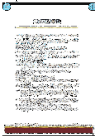
Gambar 10. Daftar Istilah