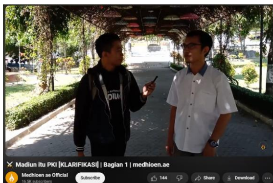
Gambar 3. Video Pembelajaran Siklus 2

Berdasarkan hasil refleksi dari pembelajaran pertama, pada siklus kedua melakukan pendekatan berbeda utamanya untuk menguji efektivitas media yang digunakan dalam meningkatkan hasil kemampuan berpikir kritis. Pada siklus kedua peneliti menggunakan video dokumenter yang diunggah oleh akun Medhioen ae Official dengan judul “Madiun itu PKI [KLARIFIKASI]” yang terbagi dalam tiga video terpisah. Video ini sama-sama mengulas tentang Pemberontakan PKI Madiun 1948 dalam bentuk vlog dan wawancara kepada sejarawan asal Madiun.