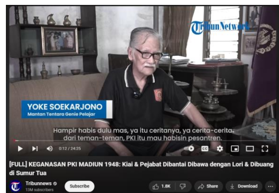
Gambar 2. Video Pembelajaran Siklus 1

Pada siklus pertama, peneliti menggunakan video dokumenter yang diunggah oleh akun Tribunnews dengan judul “Keganasan PKI Madiun 1948: Kiai & Pejabat Dibantai Dibawa dengan Lori & Dibuang di Sumur Tua”. Selama kegiatan pembelajaran berlangsung, peserta didik pada dasarnya telah menunjukkan sikap antusias yang lebih tinggi sebab terdapat keterkaitan materi dengan latar belakang mereka. Sebagian besar peserta didik telah mengetahui informasi umum seputar Pemberontakan PKI Madiun 1948 seperti periode kejadian, tokoh yang terlibat, serta bukti sejarah yang dapat ditemukan.