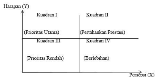
Gambar 1. Kuadran Kartesius Importance-Performance Analysis (IPA)

Analisis Importance and Performance Analysis (IPA) pada intinya menggunakan pendekatan kuadran untuk mengkaji efektifitas suatu kegiatan. Prosesnya dilakukan melalui perbandingan antara dua subyek dan obyek. Analisis ini digunakan untuk indentifikasi laju produk tertentu maupun kualitas pelayanan dalam pemasaran. Analisis ini menunjukkan performa perusahaan secara keseluruhan dan didasarkan dampak beserta tingkat kepentingannya. Analisis ini membagi ke dalam empat kuadran dengan keterangan masing-masing. Dengan adanya pembagian ke dalam empat kuadran perusahaan dapat melihat atribut mana yang seharusnya diperbaiki dan ditingkatkan kembali. Berikut adalah kuadran kartesius Importance-Performance Analysis .