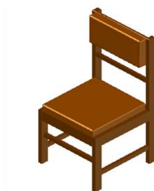
Gambar 3. Gambar Rancangan Kursi

Setelah ukuran perancangan kursi ditentukan maka tahap selanjutnya adalah menggambar rancangan kursi. Gambar rancangan kursi tersebut dapat dilihat pada Gambar 3 berikut :