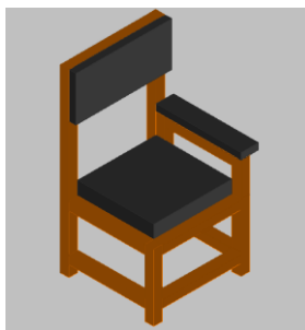
Gambar 2. Kursi Ergonomi Pembatik