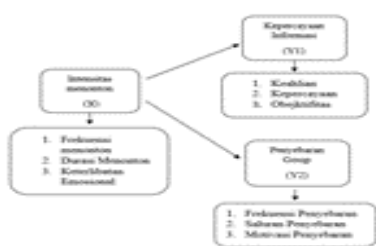
Gambar 3. Kerangka Berfikir

Berdasarkan ini, peneliti membuat kerangka pemikiran inibertujuan untuk menjelaskan dan memudahkan dan memahami pengaruh intensitas menonton konten IWil Spill the tea di youtube terhadap kepercayaan informasi dan penyebaran gosip di media sosial.