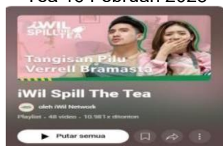
Gambar 1. Konten Youtube iWil Spill The Tea 16 Februari 2025

Konten iWil spill the tea sendiri mulai di buat pada 23 Maret 2023 yang dimana konten iWil spill the tea ini memiliki 6,27 juta subscribe , 10,981 views , dan mempunyai 48 konten, yang setiap isi kontennya berbagai macam pembahasan yang berbeda dari bintang tamu.